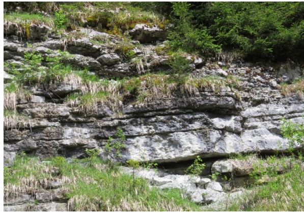
Abb. 2.14: Der Pötschenkalk der Typlokalität.