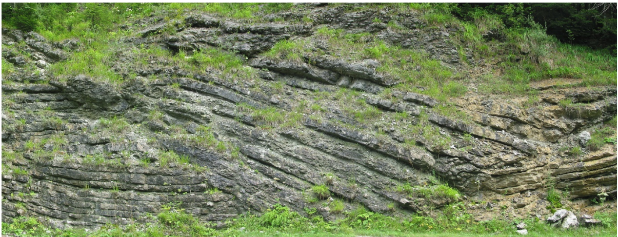
Abb. 2.18: Rutschfallen im Pötschenkalk entlang der Passstraße

Im Umfeld des Steinbruches sind entlang der Pötschenstraße ausgedehnte Rutschfallen zu erkennen, die auf ein Relief innerhalb des Ablagerungsraumes hinweisen.