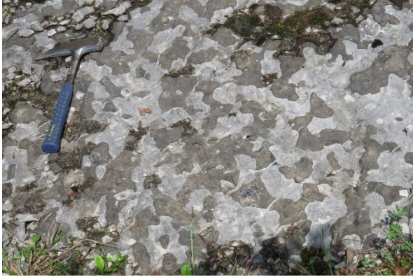
Abb. 2.16: Schichtfläche mit Hornsteinknollen