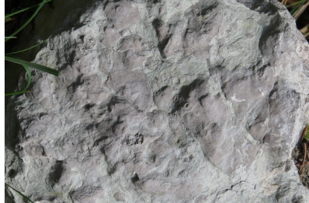
Abb. 2.17: Schichtfläche mit Mergelfasern