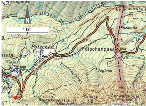
Abb. 2.13: Lage des Steinbruches.

Literatur: MOSTLER 1978, W.E.PILLER 1981, SCHÄFFER 1982 (Geolog. Karte) und MANDL, VAN HUSEN & H. LOBITZER 2012 (Erläuterungen dazu).